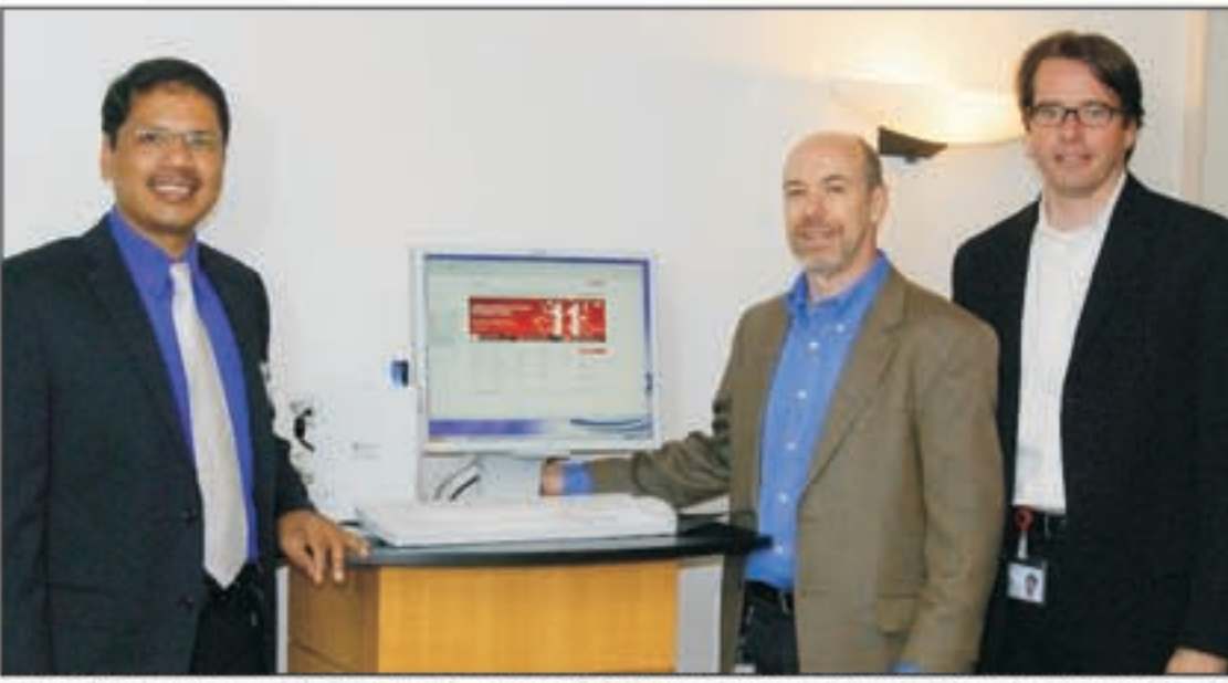
ಮಾಹಿತಿ ಕೇಂದ್ರಕ್ಕೆ ಉಚಿತ ತಾಂತ್ರಿಕ ನೆರವು ನೀಡಿದ ಅಮೆರಿಕದ ಸನ್ ಮೈಕ್ರೊಸಿಸ್ಟಮ್ಸ್ ಕಂಪನಿಯ ಹಿರಿಯ ಅಧಿಕಾರಿಗಳೊಂದಿಗೆ ಸಂಸದ ಜನಾರ್ದನ ಸ್ವಾಮಿ