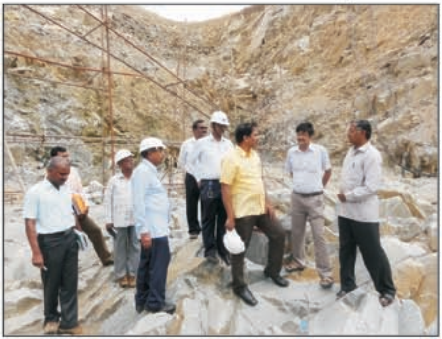
ನೀರಾವರಿ ಕೆರೆಗಳನ್ನು ತುಂಬಿಸುವ ಯೋಜನೆಯನ್ನು ರೂಪಿಸಲಾಗಿದೆ. ಕಾಮಗಾರಿ ತ್ವರಿತಗತಿಯಲ್ಲಿ ಸಾಗುತ್ತಿರುವುದನ್ನು ರೈತರು ಸಂತಸದಿಂದ ಗಮನಿಸುತ್ತಿದ್ದಾರೆ. - ಬಿ. ಜಯಣ್ಣ

ಇದೇ ಕಾಲುವೆ ಮೂಲಕ 5.6 ಟಿಎಂಸಿ ನೀರು ಬಳಸಿಕೊಂಡು ತುಮಕೂರು ಜಿಲ್ಲೆಯ ಸಣ್ಣ